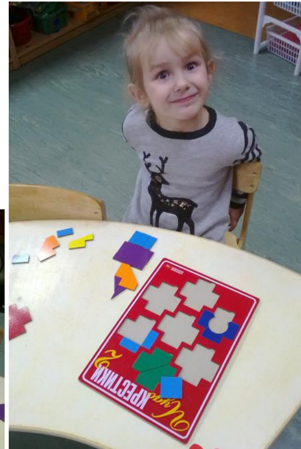
Во время самостоятельной деятельности дети придумывают свои фигурки