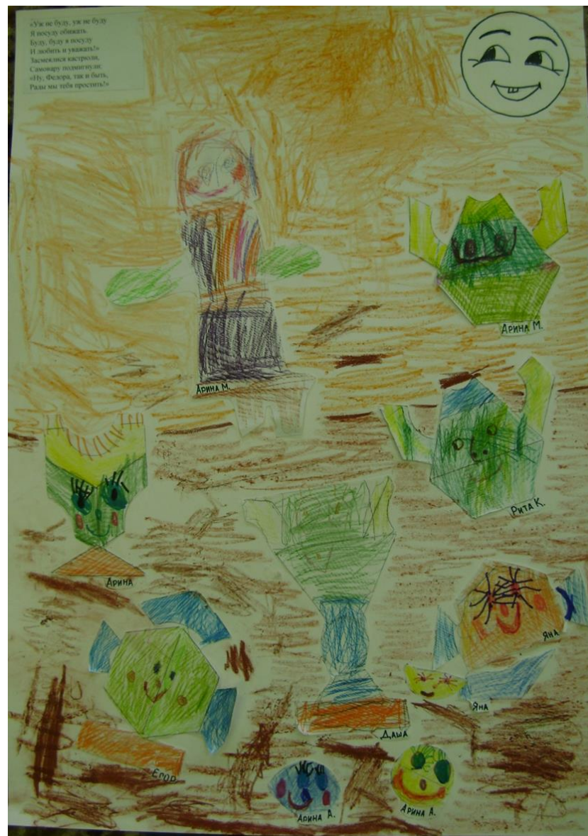
Работа с эмоциями «Федорино горе». Средняя группа