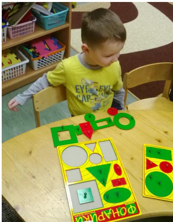
Выкладывание своих фигурок тема «Игрушки» младшая группа