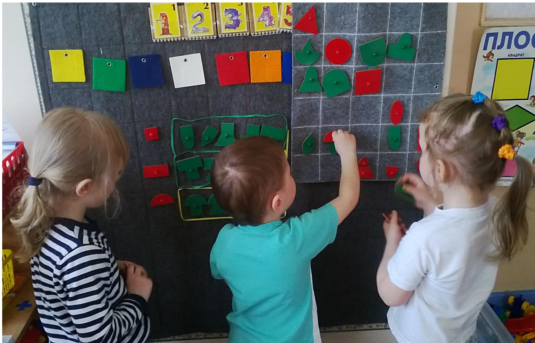
Выбор логоформочек по определённому признаку. Младшая группа.